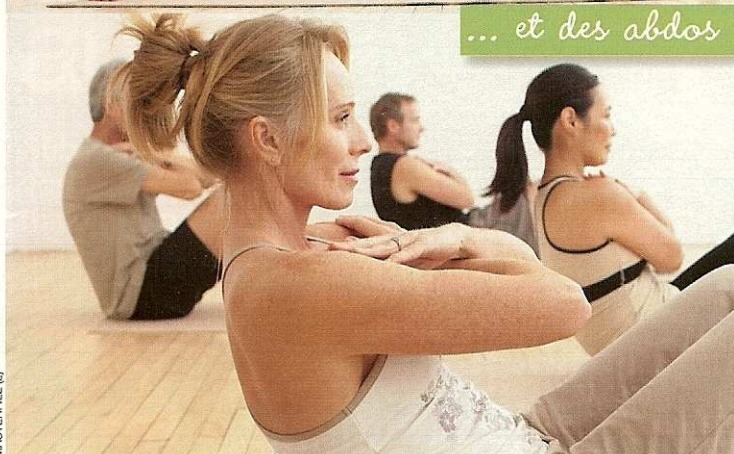
... et des abdos